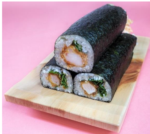
「恵方巻」※写真上段：ジャンボ海老フライ巻き 写真下段：ヒレかつ巻き

株式会社かつアンドかつ（本社：大阪府吹田市、社長：森元 芳樹）が運営する、とんかつ専門店『かつアンドかつ』は、うま味をとり込んだ本格的な味わいのやわらかな熟成ヒレかつと、約 28cm のジャンボ海老フライを巻いた「恵方巻」2 種類の予約受付を 12 月 26 日（月）から開始します。